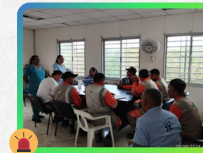
Centro Atención al Usuario - Corozal