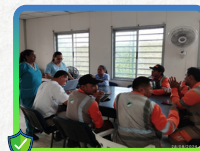
Centro Atención al Usuario - Corozal

Se impartió el conocimiento sobre cómo actuar frente a distintos peligros y riesgos de las actividades diarias, abordando las medidas de prevención para actuar en estas situaciones, brindando herramientas útiles y promoviendo el trabajo en equipo.