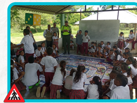
Institución Educativa Bosa Navarro Sede Calle Fria Tramo de Sampedo - Sincelajo