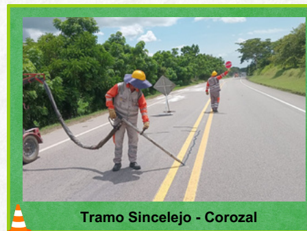
Tramo Sincelejo - Corozal