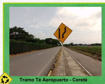
Tramo Té Aeropuerto - Cereté