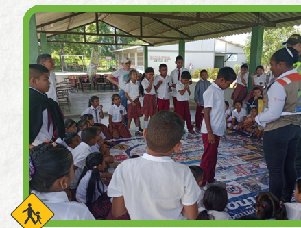
Institución Educativa Bosa Navarro Sede Calle Fria Tramo de Sampedo - Sincelajo