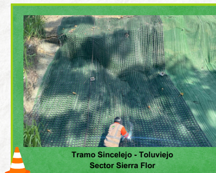
Tramo Sincelajo - Toluvejo Sector Sierra Flor