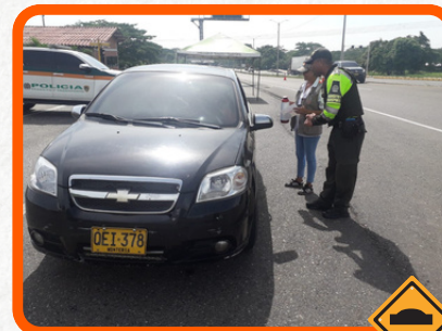
Tramo La Ye - Sahagún