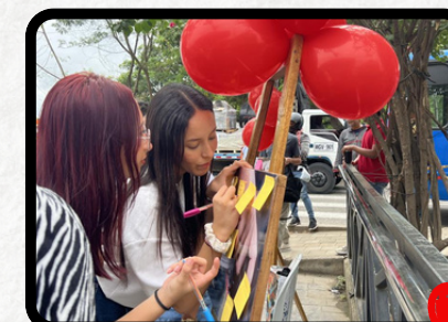
UPB Municipio de Monteria, Córdoba