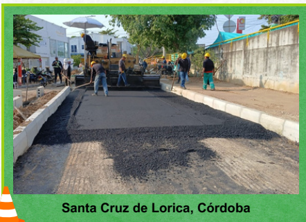
Santa Cruz de Lorica, Córdoba

El concesionario Autopistas de la Sabana S.A.S., dio continuidad a las actividades del proyecto “CONSTRUCCIÓN DE LA SALIDA DESDE LA CALLE 4 (Pavimento Flexible) Y OBRAS DE URBANISMO EN LA INTERSECCIÓN CALLE 4A CON RUTA NACIONAL 21 O CARRERA 25 EN EL MUNICIPIO DE SANTA CRUZ DE LORICA”.