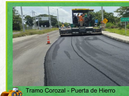
Tramo Corozal - Puerta de Hierro

De acuerdo con el plan de mantenimiento vial, el concesionario Autopistas de la Sabana S.A.S., continúa realizando actividades de mantenimiento periódico en el corredor vial Córdoba - Sucre, que incluyen la reparación de patologías (daños en la vía) existentes en la capa asfáltica y la repavimentación.