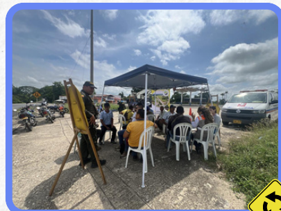
Tramo La Ye - Sahagún