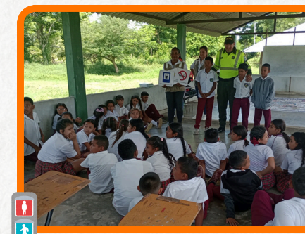
Institución Educativa Bosa Navarro Sede Calle Fria Tramo de Sampedo - Sincelajo