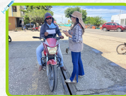
Municipio de Santa Cruz de Lorica, Córdoba