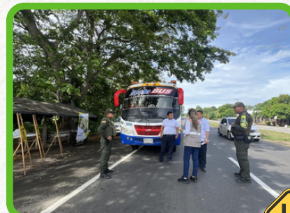
Tramo La Ye - Sahagún