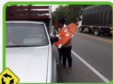
Tramo Sincelejo - Corozal