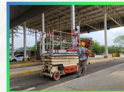
Centro de Control y Operaciones - Cereté

Promoviendo la Salud y Seguridad en el Trabajo, se impartió la capacitación Operación Segura de Sistemas de Acceso y Elevación para reforzar la atención de peligros y riesgos prioritarios de los trabajos en alturas.