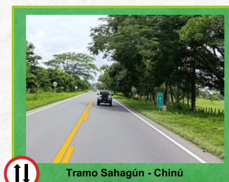
Tramo Sahagún - Chinú