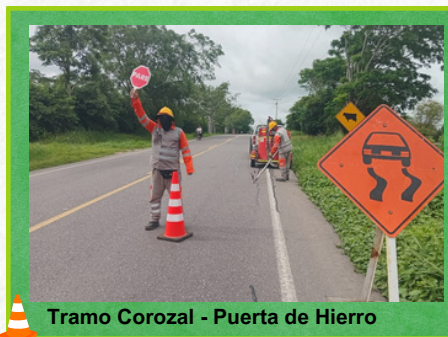
Tramo Corozal - Puerta de Hierro

El concesionario vial desde el área Técnica continúa realizando de manera permanente actividades de mantenimiento rutinario en el corredor Córdoba - Sucre.