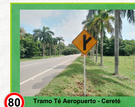
Tramo Té Aeropuerto - Cereté