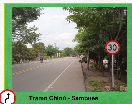
Tramo Chinú - Sampués