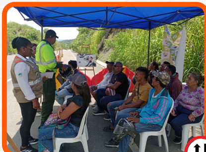
Tramo Sincelejo - Toluvejo Sector Sierra Flor