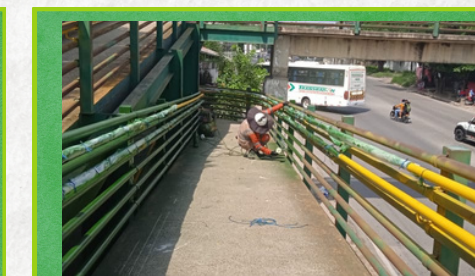
Puente peatonal Simón Araújo Paso Urbano Sincelejo