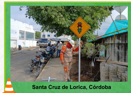
Santa Cruz de Lorica, Córdoba