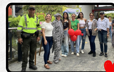
UPB Municipio de Monteria, Córdoba