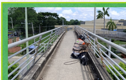
Puente peatonal UNICOR Tramo Montería (Postobón) - Té Aeropuerto

Como parte del mantenimiento rutinario y en virtud del cumplimiento de las Normas Técnicas de Accesibilidad para Puentes Peatonales en el corredor Córdoba - Sucre, el concesionario ha venido adelantando actividades de reposición de barandas metálicas, instalación de pasamanos y pintura contrastante en los elementos metálicos. Garantizando condiciones adecuadas para su uso seguro.