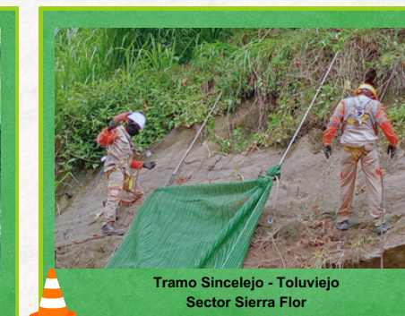
Tramo Sincelajo - Toluvejo Sector Sierra Flor