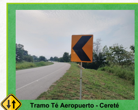
Tramo Té Aeropuerto - Cereté