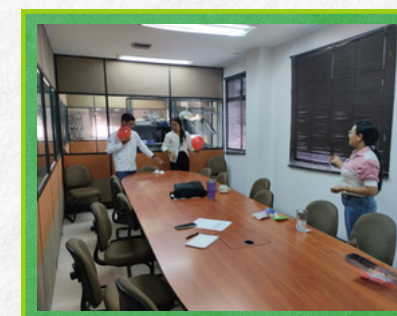
Centro de Control y Operaciones - Cérete

Con el apoyo de la ARL Seguros Bolívar se buscó reforzar las relaciones interpersonales sanas y el buen clima laboral.