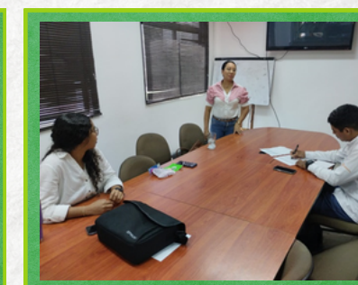
Centro de Control y Operaciones - Cérete