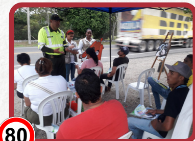
Tramo Sincelejo - Corozal