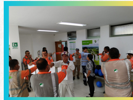
Centro de Control y Operaciones - Cérete