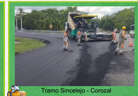
Tramo Sincelejo - Corozal