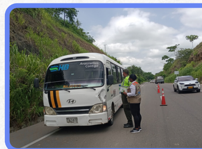
Tramo Sincelejo - Toluvejo Sector Sierra Flor