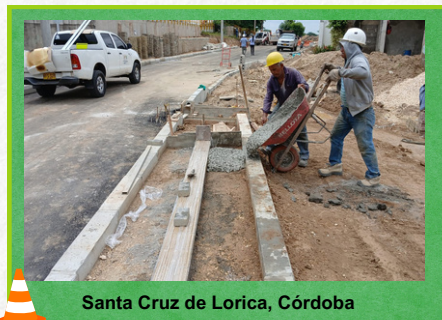
Santa Cruz de Lorica, Córdoba