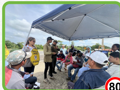
Tramo Sincelejo - Corozal