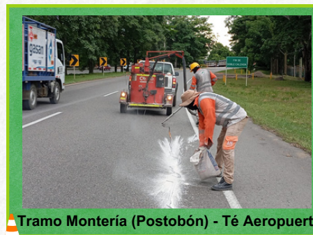
Tramo Montería (Postobón) - Té Aeropuerto