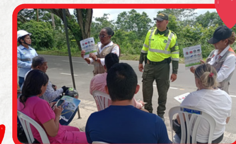
Tramo Sincelajo - Sampedo