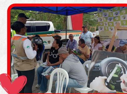
Tramo Sincelajo - Sampedo