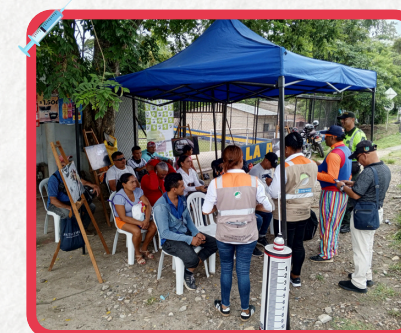
Corredor Vial Corozal - Los Palmitos