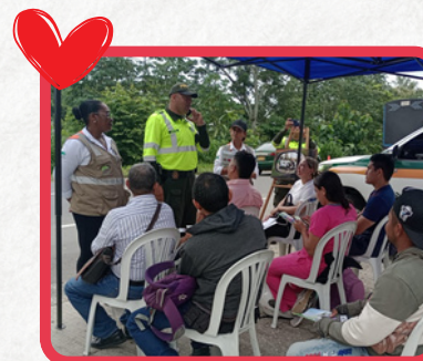
Tramo Sincelajo - Sampedo