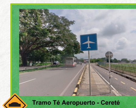
Tramo Té Aeropuerto - Cereté

Carro Taller: Esenciales para resolver problemas mecánicos que puedan surgir durante el viaje. Estos vehículos están equipados con herramientas y técnicos para prestar servicio mecánico. Este servicio es especialmente útil para aquellos conductores que sufren fallas mecánicas a lo largo del corredor vial. Con solo una llamada a las líneas de emergencia o desde los postes S.O.S., un carro taller se dirigirá al lugar para brindar asistencia y permitir que los usuarios continúen su viaje sin mayores contratiempos.