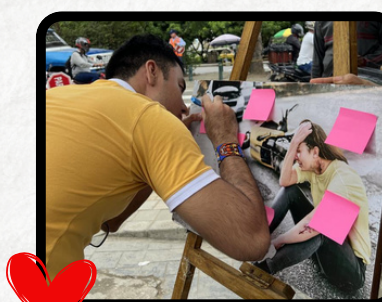
UPB Municipio de Monteria, Córdoba