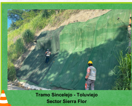
Tramo Sincelajo - Toluvejo Sector Sierra Flor

El concesionario Autopistas de la Sabana S.A.S., continua realizando la instalación de sistema integral en Sierra Flor para protección de taludes. Esto incluye inspecciones periódicas, reparaciones de estructuras de contención, drenaje de aguas pluviales, así mismo, medidas preventivas contra la erosión.