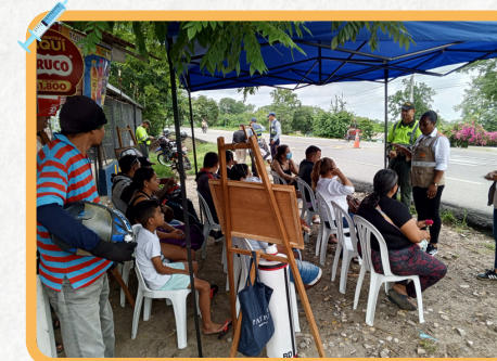
Corredor Vial Corozal - Los Palmitos