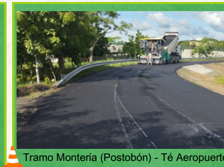
Tramo Montería (Postobón) - Té Aeropuerto