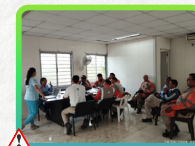
Centro Atención al Usuario - Corozal